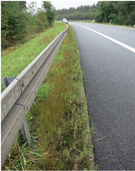
Abb. 2: Sporolobus vaginiflorus

Sporolobus vaginiflorus —TK-25 6533/44 Autobahnkreuz Altdorf, Reg.-Bez. Mittelfranken, LK Nürnberger Land, 20.9.2014, Neufund für Bayern