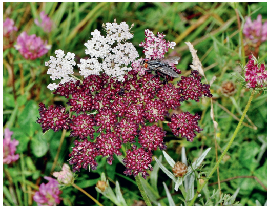
Abb. 5: Eine seltene Mutante von Daucus carota

Daucus carota L. – TK-25 6427/4, Reg.-Bez. Mittelfranken, Landkreis Neustadt an der Aisch-Bad Windsheim. 49°32,235' N, 10°18,490' E. Mutante, bei der alle Blüten bzw. ein Sektor des Blütenstandes als Mohrenblüten ausgebildet waren. Trockenrasen nordöstlich Seenheim, 1.8.2014, Herbarium ER 32093.