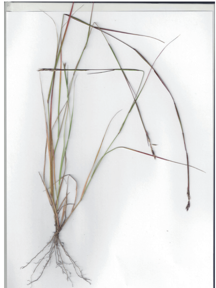
Abb. 3: Sporolobus vaginiflorus Herbarbeleg S. Nawrath