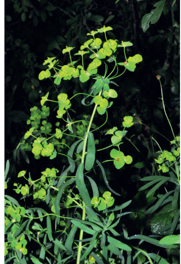
Abb. 6 und 7: Euphorbia virgultosa in Höchststadt an der Aisch