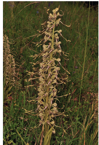
Abb. 8: Himantoglossum hircinum

Himantoglossum hircinum — TK-25 5932/31 N Oberküps, ca. 200 Ex., Reg.-Bez. Oberfranken, LK Lichtenfels, 24.5.2014 (Koordinaten bekannt)