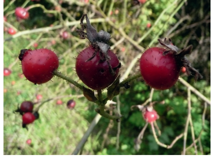
Abb. 9: Rosa sherardii

Tephrosia helenitis — TK-25 6929/33 NSG Lierenfeld, Reg.-Bez. Mittelfranken, LK Ansbach, 28.6.2014, 49°01.338'N 10°32.983'E