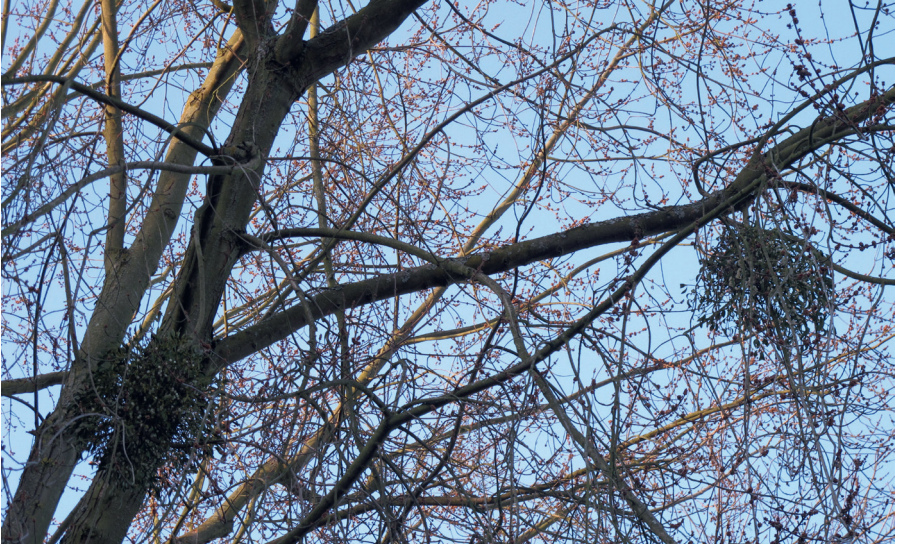
Abb. 4: Viscum album auf Silberahorn