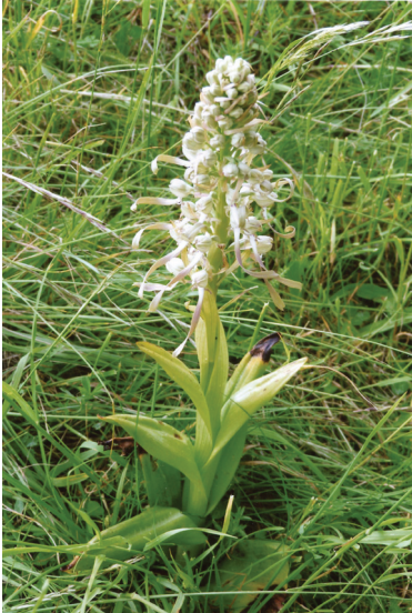
Abb. 3: Himantoglossum hircinum in voller Pracht