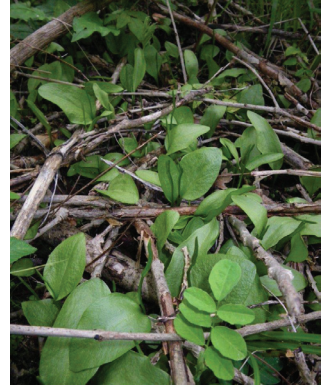
Abb. 6: Ophioglossum vulgatum