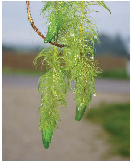
Abb. 2: Myriophyllum heterophyllum , aus dem Wasseer gefischtes Teilstück