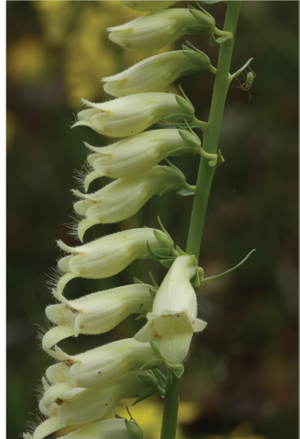
Abb. 2: Digitalis lutea am Görauer Anger