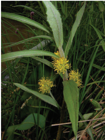
Abb. 7: Lysimachia thyrsiflora L.