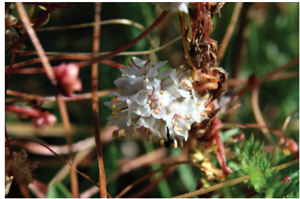
Abb. 5: Cuscuta epithymum

Cuscuta epithymum (L.) L. - TK-25 6331/1, Regierungsbezirk Mittelfranken, Landkreis Erlangen-Höchstadt, NSG „Moorhof“, 18.9.2012, Wiederfund für 6331/1 (O in FdR 2003). Die Wiese wurde bis vor einigen Jahren sehr intensiv bewirtschaftet; inzwischen ist sie im Besitz des Landkreises und wird nicht mehr gedüngt. Wirtspflanze: Centaurea jacea . Fundortfoto v. 18.9.2012.