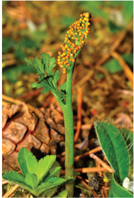
Abb. 1: Vitale, fertile Pflanze von Botrychium matricariifolium am neu entdeckten Wuchsort im NSG Tennenloher Forst.

Botrychium matricariifolium (A. Braun ex Döll) W. D. J. Koch — TK-25 6432/143, Regierungsbezirk Mittelfranken, Landkreis Erlangen-Höchstädt, Mittelfränkisches Becken, Forstabteilung Siebenstein südöstlich des Turmbergs im NSG „Tennenloher Forst“ innerhalb der Gehegeerweiterung für die Przewalski-Pferde, 22.6.2010, Ellen Mardach. Eine Bestätigung des Fundes erfolgte am 9.7.2010 durch S. Böger, A. Kerskes und J. Marabini. 31.5.2011 leg. & det. J. Marabini, Herbar ER 24121. Am 27.5.2011 wurden durch A. Kerskes und K. Horn an zwei dicht benachbarten Wuchsstellen insgesamt 39 fertile Exemplare (24 bzw. 15 Triebe) gezählt (vgl. Abb. 1). Während einer erneuten Begehung am 5.6.2012 durch S. Böger, A. Kerskes und K. Horn wurden insgesamt 56 Triebe gezählt, von denen die kräftigsten eine Höhe von 20 cm aufwiesen. Die Art wächst hier in lückigen Sand-Magerrasen am Rande eines Kiefern-Forstes. Weitere Daten zum Standort sowie zur Vergesellschaftung sollen in einer separaten Publikation mitgeteilt werden. Wiederfund für den Quadranten nach 1945. RL BY 2.