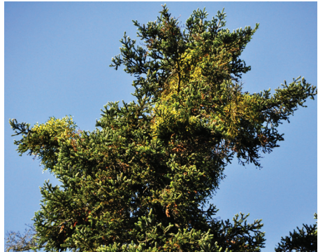
Abb. 8: Viscum album subsp. abietis auf einer alten Tanne Foto: W. Weiß, 9.9.2012

Janch. – TK-6431/332, Regierungsbezirk Mittelfranken, Landkreis Erlangen-Höchstädt, am Nordrand des NSG „Wildnis am Rathsberg“ auf (mindestens) drei alten Tannen (49° 37,255' N, 11° 1,650' E, 350 m) Fundortfoto: 9.9.2012 Walter Weiß, Neufund für den Quadranten