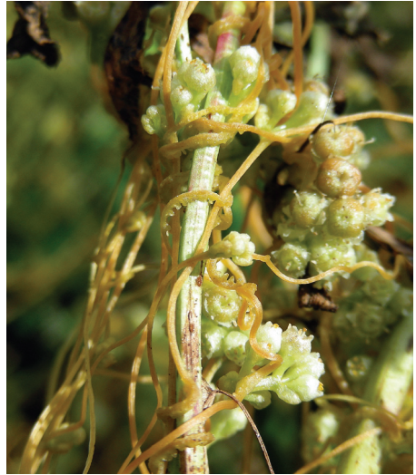
Abb. 3: Cuscuta campestris Yunck

Chimaphila umbellata (L.) Barton — TK-25 6432/132, Regierungsbezirk Mittelfranken, Landkreis Erlangen-Höchstädt, Mittelfränkisches Becken, Randbereich eines Forstweges im NSG Tennenloher Forst nordnordwestlich des Turmbergs, 29.7.2009, K. Horn, 12 sterile und zwei fruchtende Triebe auf einer Fläche von 4 × 0,5 m in einem Kiefern-Forst mit dichter Roteichen-Unterforstung. Im Zuge von Pflegemaßnahmen am Wuchsort im Frühsommer 2010 konnten weitere Triebe entdeckt werden, so dass sich der Gesamtbestand auf rund 45 Sprosse beläuft. Eine gezielte Nachsuche nach weiteren Fundstellen in der näheren Umgebung blieb erfolglos. RL BY 1.