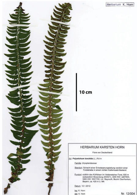
Abb. 4: Herbarbeleg des Neufundes von Polystichum lonchitis im Veldensteiner Forst, Herbar K. Horn (12/004)