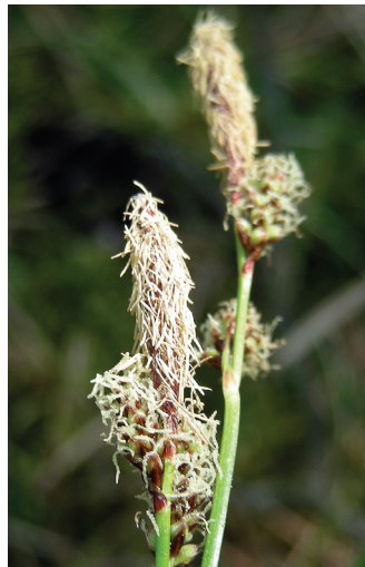
Abb. 2: Carex ericetorum Pollich

Carex ericetorum Pollich – TK-6433/2, Regierungsbezirk Mittelfranken, Landkreisgrenze Nürnberger Land/ Erlangen-Höchstadt, östlich Bullach, Steinbühl, alte Sandabgrabung, 25.4.2011, leg. & det. Rudolf Höcker (Hb Höcker), ca. 100 Exemplare (Wiederfund nach einem Hinweis von W. Subal).