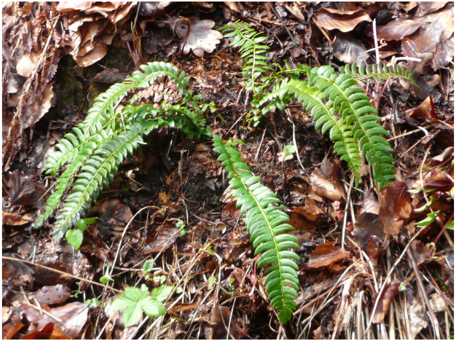
Abb. 3: Polystichum lonchitis , Waldwegrand s. Nankendorf.

Verbreitung im Regnitzgebiet: Sehr selten und fast immer nur in Einzelexemplaren auf Kalkfelsen, Kalkschutt und in Doggerhohlwegen der Fränkischen Alb sowie im Veldensteiner Forst (GATTERER & NEZADAL 2003).