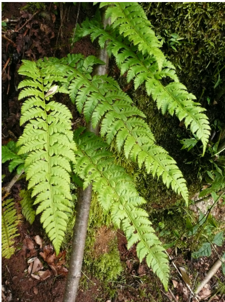
Abb. 1: Polystichum aculeatum, Bacheinschnitt Haidling