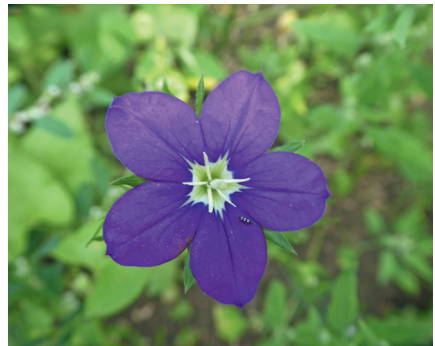
Abb. 4: Legousia speculum-veneris Foto: Wagenknecht, 4.7.2020