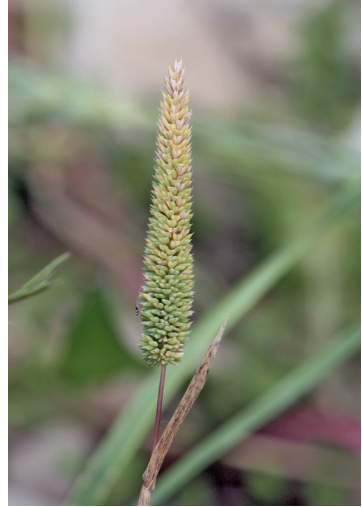
Abb. 7: Phleum paniculatum am Acker- rand