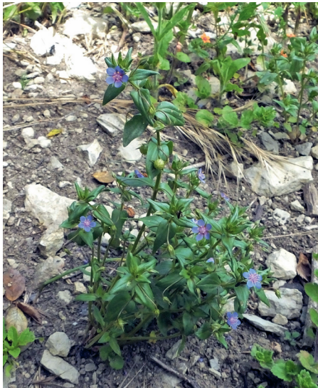
Abb. 3: Anagallis foemina

5) Uetzing (04. Juli – 5932/1). 44 N, 102 V, 2 W. Staffelsteiner Alb. 12 Teilnehmer. Leitung G. Hetzel