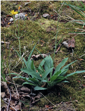
Abb. 8: Hieracium franconicum, Ober- kante Hardtfels