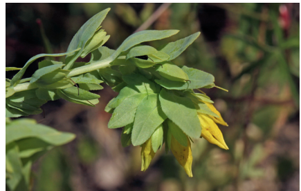
Abb. 5: Cerinthe minor auf Jurahochfläche