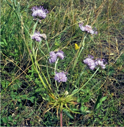
Abb. 6: Scabiosa columbaria mit Gallwespenbefall, Alter Staffelberg, 25.7.2020