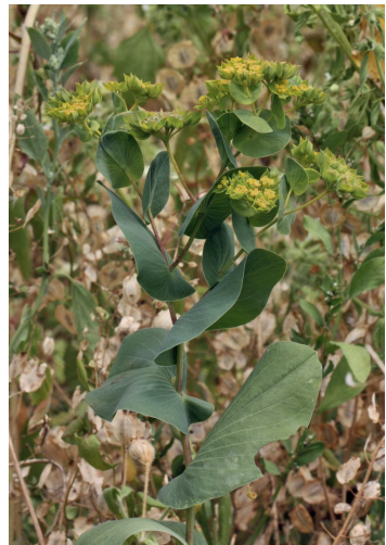
Abb. 9 (rechts): Bupleurum rotundifolium, Kalkscherbenacker