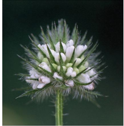
Abb. 2: Dipsacus pilosus , Uetzing nahe Parkplatz Foto Schillai, 4.7.2020