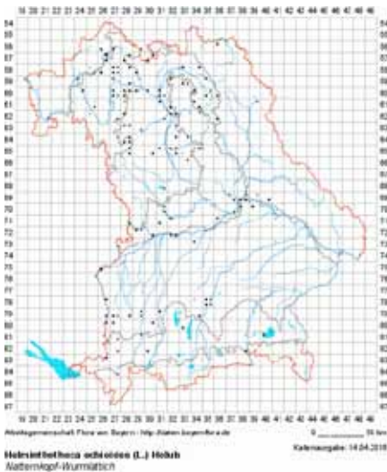
Helminthotheca echioides , Verbreitung in Bayern

Bei Helminthotheca echioides handelt es sich um ein mediterranes Florenelement. Sicherlich hat es in der Jungsteinzeit mit der Entwicklung des Ackerbaues und des Sesshaftwerdens des Menschen mit Samen aus dem Mittelmeergebiet seinen Weg nach Mitteleuropa gefunden, heute allerdings durch Saatgut. Vielleicht deshalb auch die Bezeichnung als Wanderpflanze. Seine südliche Hauptverbreitung ist der Grund für die Unbeständigkeit und dem heutigen spontanen Vorkommen der Art. So erklärt sich auch das seltene Vorkommen im Arbeitsgebiet der Regnitzflora und darüber hinaus.