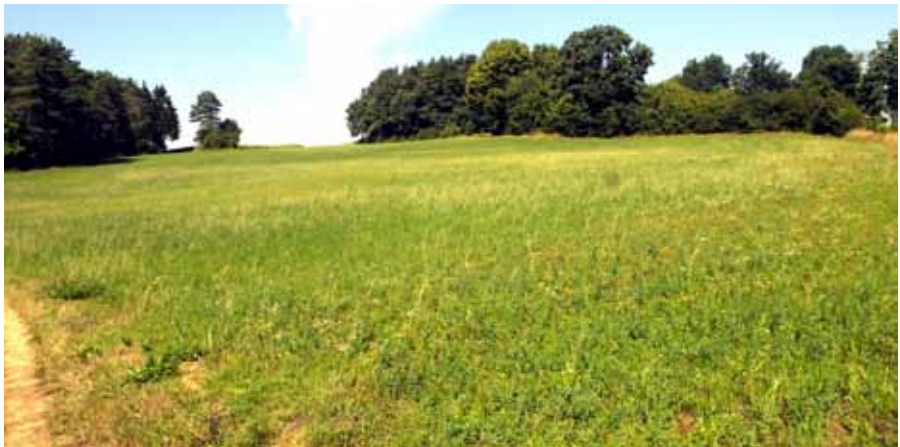
Biotop mit Helminthotheca echioides

Am 23. August 2015 war ich zur Pflanzenkartierung in dem Kartenblatt 6234 Pottenstein im Quadranten 1 südwestlich der Ortschaft Weidmannsgesees unterwegs. Mein Ziel war die Überprüfung mir bekannter historischer Fundorte der Sand-Strohblume ( Helichrysum arenarium ). Wegen des sehr heißen und sehr regenarmen Sommers und der dadurch verbundenen Stresssituation für viele Pflanzen erschien es mir lohnend, nach dieser Pflanze zu suchen, sind ihr doch diese Witterungsverhältnisse eher zuträglich. Vor etwa zwanzig Jahren hatte diese immer schon seltene Art einige Fundorte an den dort dolomitsandigen, offenen Kiefernwaldrändern. Zwischenzeitlich ist sie an allen diesen Standorten verschollen oder erloschen. Als Ursachen kommen entweder Verbuschung beziehungsweise das Zuwachsen der Waldränder oder der Düngereintrag von den angrenzenden landwirtschaftlichen Nutzflächen sowie der Nährstoffeintrag aus der Luft in Frage. Benachbart war dort in den früher lichten Kiefernwäldern auch der Berg-Wohlverleih ( Arnica montana ) immer wieder auf den kleinflächig vorhandenen Kreidesandüberdeckungen zu finden. Diese Vorkommen sind heute ebenfalls erloschen. Kaum jemand hat diesen Biotopen aus Sicht des Natur- und Artenschutzes Beachtung geschenkt. Als touristische Attraktion sind sie kaum zu vermarkten und deshalb wurde deren Schutz und Pflege wohl auch vernachlässigt oder vergessen.