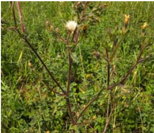
abblühend und fruchtend, anthocyanhaltig