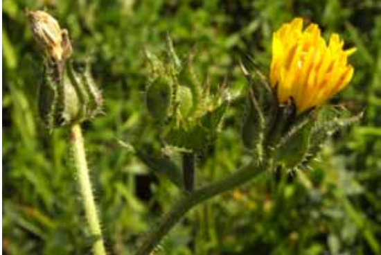
blühend und fruchtend