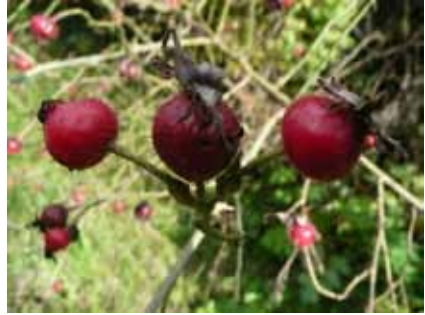
Abb. 9: Rosa sherardii

Tephrosia helenitis — TK-25 6929/33 NSG Lierenfeld, Reg.-Bez. Mittelfranken, LK Ansbach, 28.6.2014, 49°01.338'N 10°32.983'E