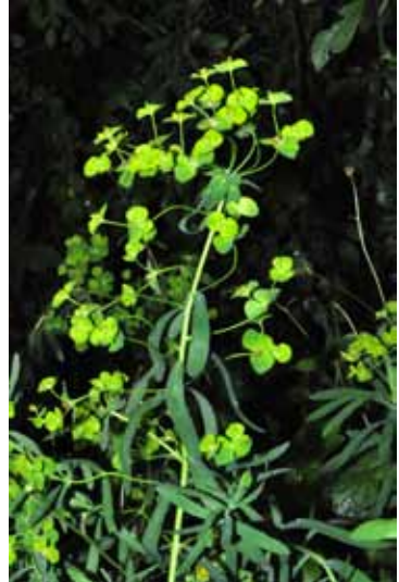
Abb. 6 und 7: Euphorbia virgultosa in Höchststadt an der Aisch