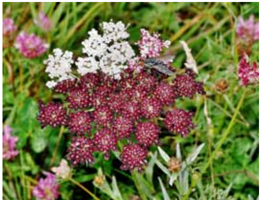
Abb. 5: Eine seltene Mutante von Daucus carota

Daucus carota L. – TK-25 6427/4, Reg.-Bez. Mittelfranken, Landkreis Neustadt an der Aisch-Bad Windsheim. 49°32,235' N, 10°18,490' E. Mutante, bei der alle Blüten bzw. ein Sektor des Blütenstandes als Mohrenblüten ausgebildet waren. Trockenrasen nordöstlich Seenheim, 1.8.2014, Herbarium ER 32093.