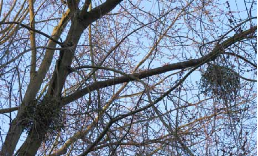
Abb. 4: Viscum album auf Silberahorn