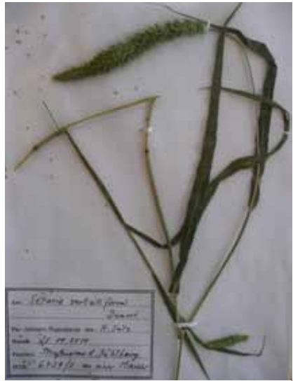
Abb. 10: Setaria verticilliformis