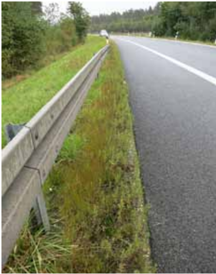
Abb. 2: Sporolobus vaginiflorus

Sporolobus vaginiflorus —TK-25 6533/44 Autobahnkreuz Altdorf, Reg.-Bez. Mittelfranken, LK Nürnberger Land, 20.9.2014, Neufund für Bayern