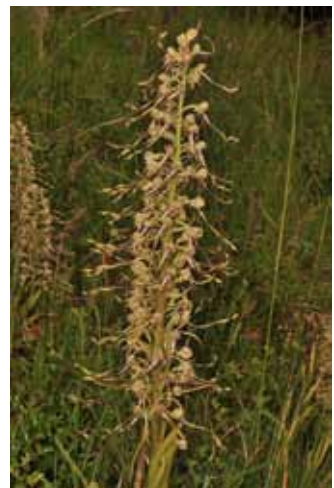
Abb. 8: Himantoglossum hircinum

Himantoglossum hircinum — TK-25 5932/31 N Oberküps, ca. 200 Ex., Reg.-Bez. Oberfranken, LK Lichtenfels, 24.5.2014 (Koordinaten bekannt)