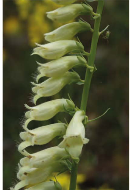
Abb. 2: Digitalis lutea am Görauer Anger