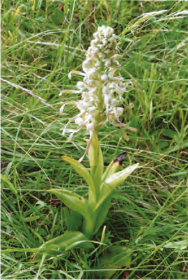
Abb. 3: Himantoglossum hircinum in voller Pracht