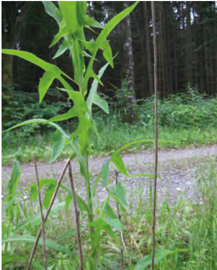
Abb. 1: Sonchus palustris in der Weigenheimer Au

Myriophyllum heterophyllum Michx. – TK-25 6634/43, Reg.-Bez. Oberpfalz, Landkreis Neumarkt, Gemeinde Berg b. Neumarkt, alter LMD-Kanal, 11.9.2013, Nr. 6476 Herbar Fürnröhr, leg F. Fürnröhr, det. Klaus v. d. Weyer, Neufund für Bayern.