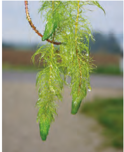
Abb. 2: Myriophyllum heterophyllum , aus dem Wasseer gefischtes Teilstück