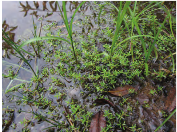
Abb. 5: Crassula helmsii

Crassula helmsii (Kirk) Cockayne – TK-25 6633/132, Regierungsbezirk Mittelfranken, Landkreis Nürnberger Land, Jägersee Südost-Ufer, westl. Feucht b. Nürnberg, 2. 9. 2013, leg. & det. Peter Reger (nach einem Hinweis von R. Edlmann), Herbar P. Reger, Zweitfund für die Regnitzflora. Die Landform bildet dichte Matten am Uferand. Die Unterwasserform könnte mit Callitriche -Arten verwechselt werden. (Abb. 5)