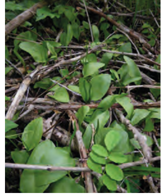
Abb. 6: Ophioglossum vulgatum