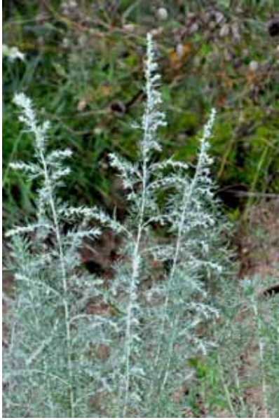
Abb. 1: Der Österreichische Beifuß ( Artemisia austriaca) von einem seit über 300 Jahren belegten Fundort bei Nürnberg befindet sich seit Jahrzehnten in Erlangen in einer Erhaltungskultur.

bayern- oder sogar deutschlandweit ihre letzten Wuchsorte in Mittelfranken. Daneben werden mit den seltenen endemischen Mehlbeeren-Arten ( Sorbus spp.) der Frankenalb (Abb. 3) Arten kultiviert, die weltweit nur hier vorkommen.