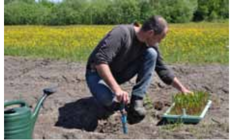
Abb 6: Auspflanzen nachgezogener Exemplare des Doppelzähligen Löwenzahns ( Taraxacum geminidentatum ) auf zuvor speziell präparierten Flächen am Wildstandort als populationsstützende Maßnahme. Foto: A. Kerskes, Mai 2011

Der Botanische Garten Erlangen wird sich trotz des geringen Raumangebotes und begrenzter personeller Ressourcen auch weiterhin an Maßnahmen beteiligen, die helfen sollen, die pflanzliche Vielfalt unserer Heimat zu erhalten.