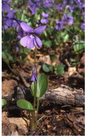
Abb 4: Das mittlerweile extrem seltene Moor-Weilchen ( Viola uliginosa ) in einem Moor-Bruchwald an einem seiner letzten deutschen Wuchsorte in der Lausitz (Sachsen).

Im Landschaftspark von Schloss Dennenlohe am Hesselberg wurden Flächen zur Verfügung gestellt, auf denen zukünftig einige der im Botanischen Garten Erlangen nachgezogenen