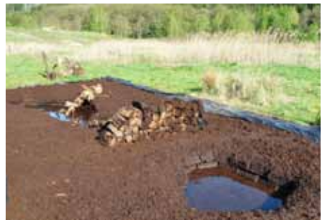
Abb. 8: Frisch angelegtes Hochmoor-Beet im Landschaftspark von Schloss Dennenlohe für weitere Erhaltungskulturen in größerem Maßstab.