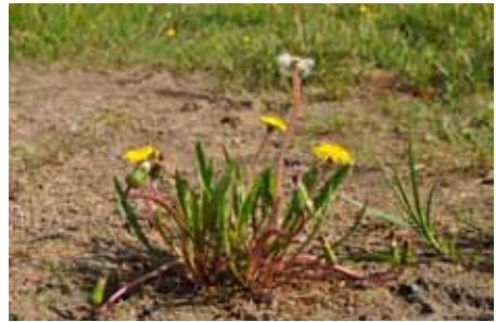
Abb 7: Blühender Doppelzähliger Löwenzahn ( Taraxacum geminidentatum ) ein Jahr nach der Auspflanzung. Foto: A. Kerskes, Mai 2012