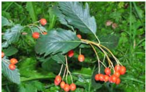
Abb. 3: Die Hohenester-Mehlbeere ( Sorbus hohenesteri) im Botanischen Garten Erlangen als Beispiel für eine Reihe z. T. sehr seltener endemischer Mehlbeeren der Frankenalb.