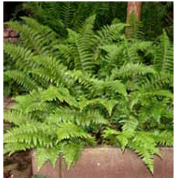
Abb. 5: Im Jahr 2003 initiierte Erhaltungskultur des vom Aussterben bedrohten Weichen Schildfarns ( Polystichum braunii ) aus dem Nationalpark Bayerischer Wald (Niederbayern).