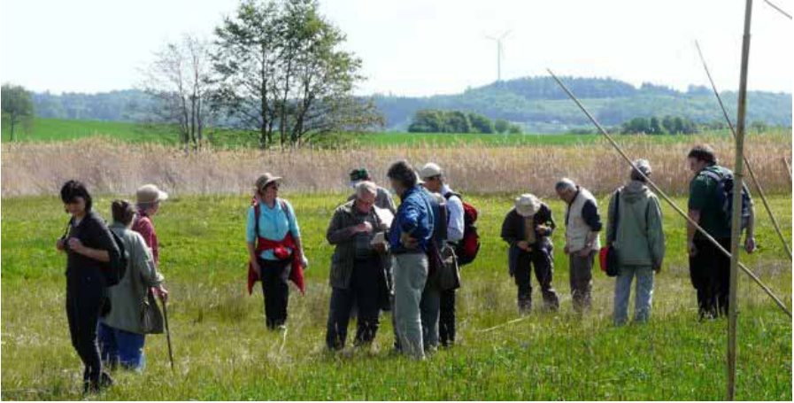
Abb. 1: Exkursion Dorfgütingen - endlich geht es wieder los.