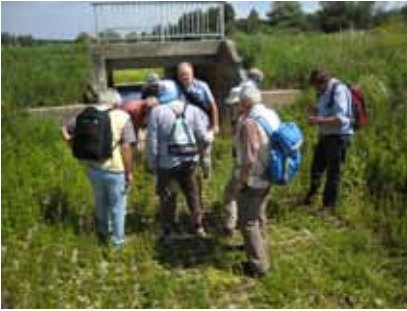
Abb. 5: Fundort von Teucrium scordium - Flutmulde unter der Straße

11) Breitbach (08. Oktober - 6128/4), 25 N, 136 V, davon 3 W.