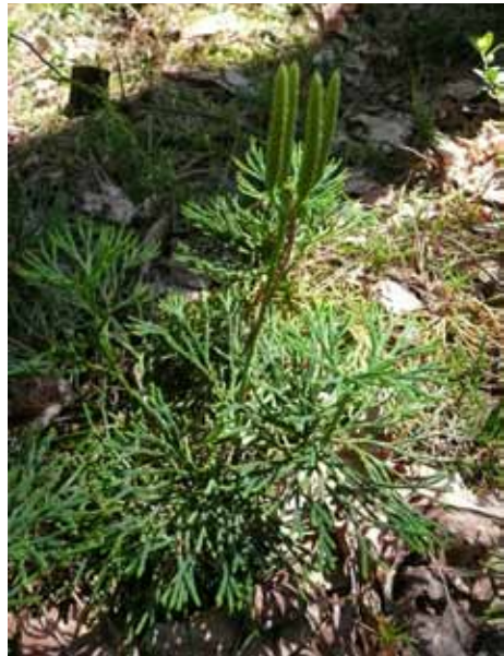
Abb. 4: Diphasiastrum zeileri