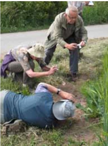
Abb. 2: Scandix pecten-veneris , der Venuskamm, ein begehrtes Fotomodell