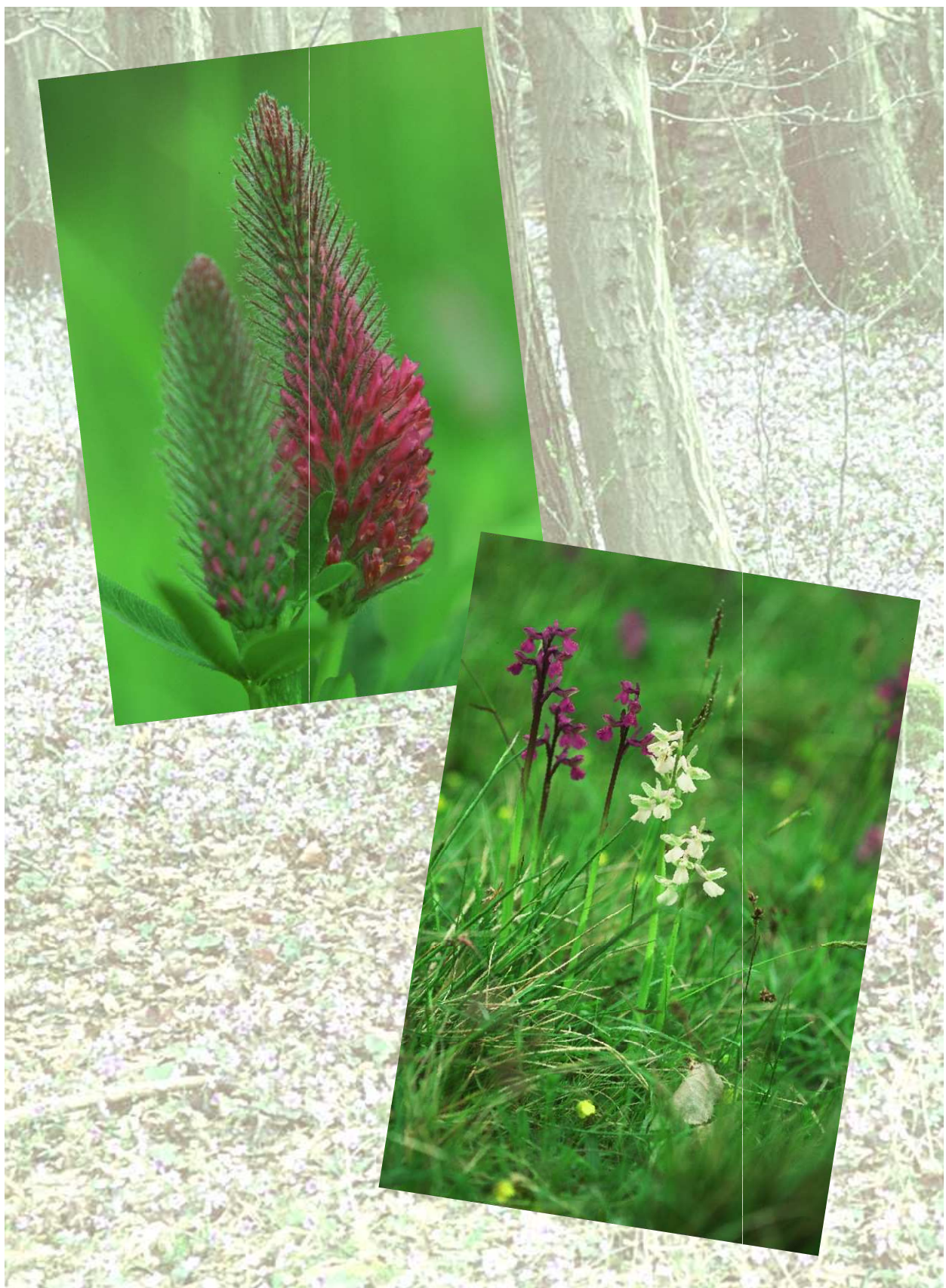
Purpur-Klee ( Trifolium rubens ), Kollerberg bei Berolzheim, Juni 2001 (oben)