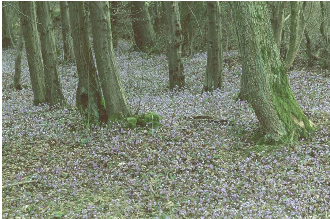
Leberblümchen ( Hepatica nobilis ), nördlich Bühlberg, 2005

Die Bilder auf dieser und den folgenden Seiten geben einen kleinen Einblick in das naturfotografische Wirken unseres Mitglieds Hermann Weiß.